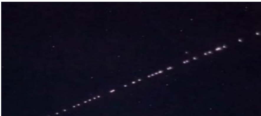
I satelliti "Starlink" di Elon Musk

AFFIDARSI ciecamente e per intero alla tecnica è un rischio grande tanto quanto ignorarne le possibilità effettive. Perché, se è vero quanto affermava Marx nel famoso Frammento delle macchine , che il capitalismo ribalta il rapporto dell'uomo con la natura, trasformandolo in uno strumento, togliendogli l'iniziativa e instillando direttamente la scienza nei macchinari, allora sarebbe del tutto contraddittorio affidarsi in toto alle macchine stesse, confidare nella possibilità di liberazione che esse garantirebbero e nella possibilità che siano esse a "sciogliere" finalmente l'umanità dalle catene. Il fatto è che non può essere la tecnica da se stessa a cambiare la vita delle persone. Il compito tocca invece alla politica, all'iniziativa umana, alla lotta dei subordinati, ai conflitti politici e sociali, allo sviluppo integrale della democrazia. Senza