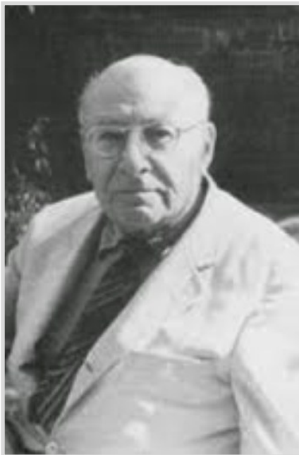
René Arpad Spitz (1887, Vienna - 1974, Denver, Colorado, Usa) è stato un medico, psicologo e psicoanalista austriaco naturalizzato statunitense. Valorizzò il ruolo formativo della madre tramite l'osservazione diretta dell'interazione madre-bambino

IN UN PAESE , come il nostro, in cui la rete di welfare a sostegno delle madri è per il 58% rappresentato dalle famiglie e per il 29% dai servizi pubblici, diventare madre è ancora più marcatamente una scelta d'amore. La maternità, che già di per sé rappresenta un naturale amplificatore di potenza nella donna, con una adeguata rete di sostegno pubblica, potrebbe essere il qualcosa in più da portare in tutti gli ambiti dell'agire. Una condizione di vita che esalti e valorizzi la personalità, anziché, come spesso accade, porla di fronte a conflitti interiori e difficoltà che spesso non si riesce a sostenere. Una società civile risponde e contiene la fragilità dei bambini e delle madri con servizi e sostegni di