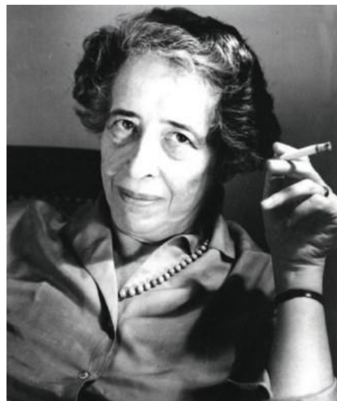
Hannah Arendt

IN ALTRI TERMINI , se è vero che ogni nostra azione avviene in un contesto di consequenzialità che ci sfugge, è anche vero che l'agire implica di per sé una pluralità di intenti e di atti, che hanno un imprescindibile inizio individuale per poi dilatarsi in senso trasversale e plurale, innescando un "processo di senso" che coincide con l'agire e con sempre nuove determinazioni inattese che modificano ciò che sembrava definitivamente affidato alla necessità. A questo punto l'agire si può fare tecnica del cambiamento e possibilità di speranza attiva, di costruzione di visioni alternative che partono dall'azione di un soggetto e aprono a infinite circostanze possibili determinate dalla pluralità delle risposte. Non si tratta di avvenirismo o escatologismo, come negativamente e banalmente si potrebbe pensare, ma dell'ipotesi di una "discontinuità", a cui non ci si può sottrarre, se non negando il contesto stesso in cui avviene. Perciò un inizio, anzi l'inizio, non in senso assoluto, ma un inizio da cui prendono forma altri inizi, come possibilità e non come necessità, giacché ogni evento è più legato al futuro che non al