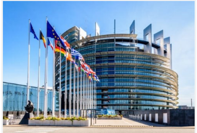
La sede del Parlamento europeo a Strasburgo (Francia)

Enfasi a parte, è evidente che si tratta di una riflessione imprescindibile e improrogabile, non solo nel contesto che stiamo vivendo (scrivo queste note prima delle faticose elezioni europee del 9 giugno), ma anche e soprattutto nella sempre nuova e cangiante realtà geopolitica che gli svi-