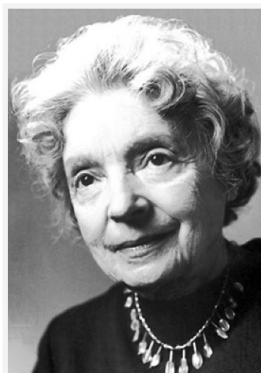
Nelly Sachs

bile dare voce a chi la voce è stata sottratta, possibile scrivere epitaffi nell’aria, possibile intonare cori delle cose abbandonate, delle ombre e dei morti. Meglio, rende possibile scrivere tra il 1943 e il 1946 un’opera come In den Wohnungen des Todes, Negli appartamenti della morte , pubblicata di recente nella prima edizione italiana completa dalla casa editrice Giuntina a cura di Anna Ruchat.