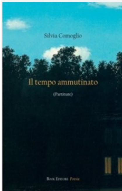
Silvia Comoglio, Il tempo ammutinato (Partiture) , Ferrara, Book Editore, 2023, pp. 70, euro 18,00

luppa e approfondisce il senso della sua arte, che è ricerca dell'orizzontalità del verbo e scoperta della verticalità del suo significante; orizzontalità e verticalità che muovono dal profondo del proprio essere ed emergono nella solitudine dell'artista: alla poeta spetta il compito di coglierne la genesi e di svezzarne la fragilissima natura per compiere il prodigio di dare un corpo a ciò che altrimenti sarebbe solamente un impalpabile ed effimero soffio.